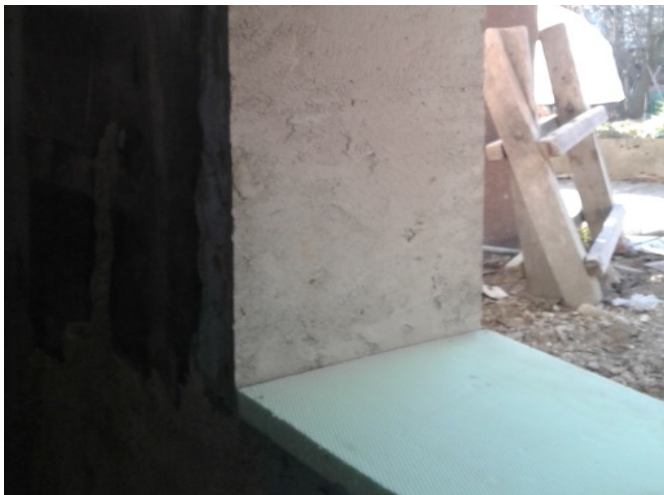
Pravilno pripravljena okenska odprtina (novogradnja)