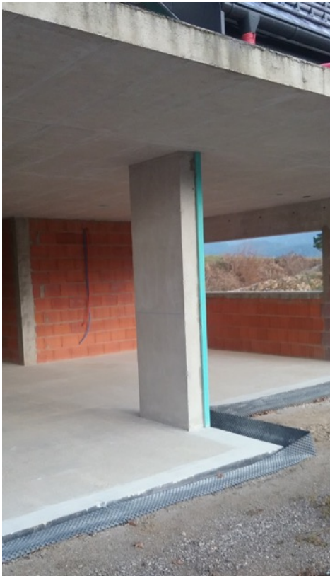
Pripravljene okenske odprtine

Na objektu, kjer vgrajujemo okna, mora biti omogočen dostop za dostavo oken ter v primeru uporabe dvigal, utrjen in zravnani teren. Če dostop do objekta ali do posameznih okenskih odprtin ni omogočen ali pa so prostori objekta zapolnjeni z gradbenim materialom oziroma podprti s podpornimi elementi, se monTERSka ekipa lahko skupaj z okni vrne v proizvodne obrate in se vrne na objekt, ko bodo pogoji za to izpolnjeni.