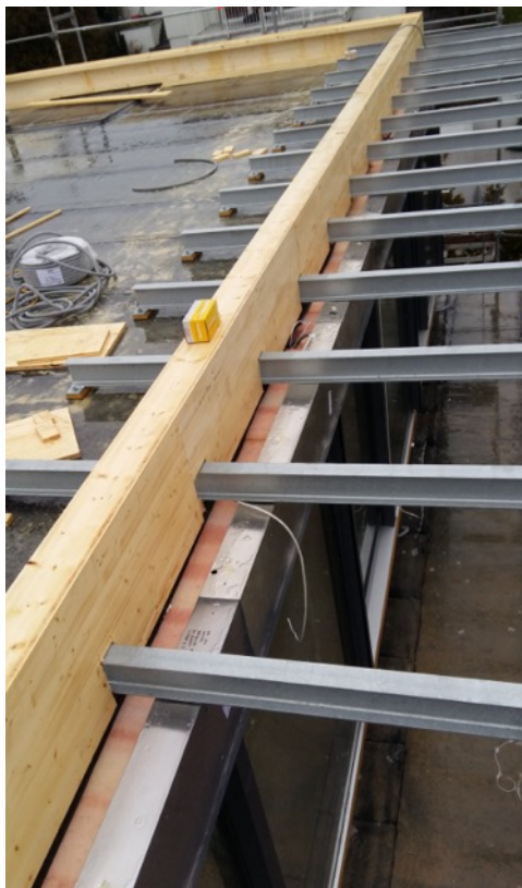
Senčila in okna so vgrajena po smernicah RAL

Materiali pa niso 100% vodotesni proti močnim nalivom ali pri stoječi vodi. V takih primerih lahko voda pronica skozi material v notranjost objekta. Med gradnjo mora stranka sama poskrbeti za dodatno tesnjenje nad okni in senčili. Kakršne koli poškodbe na oknih ali v notranjosti objekta iz tega naslova niso odgovornost M SORA.