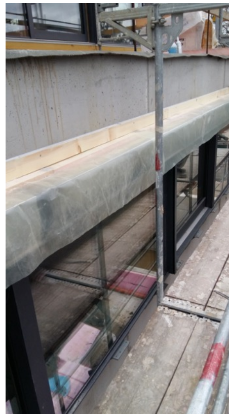
Dodatna vodotesnost senčil (ni v ceni RAL montaže)