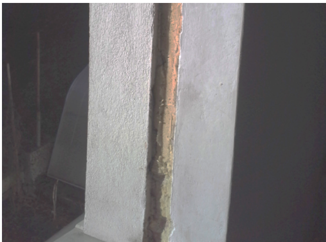
Pravilno pripravljena okenska odprtina (prenova)

Okenske odprtine morajo biti pripravljene pred vgradnjo oken. Pred samo montažo mora stranka pripraviti okenske odprtine, ki niso več kot 2cm večje od dimenzije oken. Prav tako pa morajo biti okenske odprtine ravne in zaglajene z ometom ali lepilom, da omogočajo kvalitetno izvedbo RAL montaže (tesnjenje v treh ravninah). V kolikor so okenske odprtine neravne, grobe ali z luknjami, kvalitetna, zrakotesna vgradnja oken ni mogoča. M Sora lahko v primeru neustrezno pripravljenih odprtin odkloni vgradnjo oken, dokler se špalete ne obdelajo.