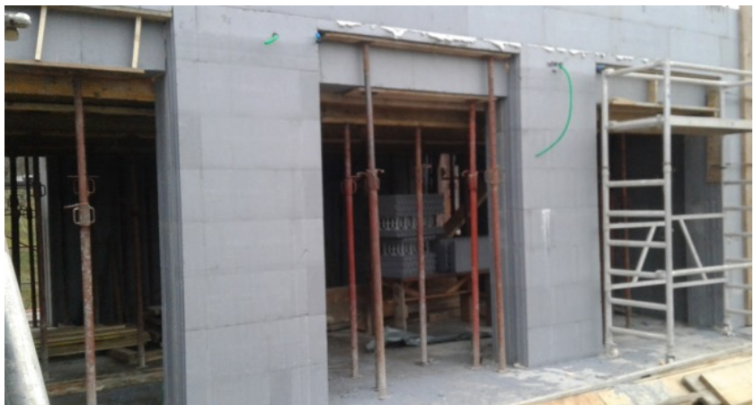
Nepripravljene okenske odprtine