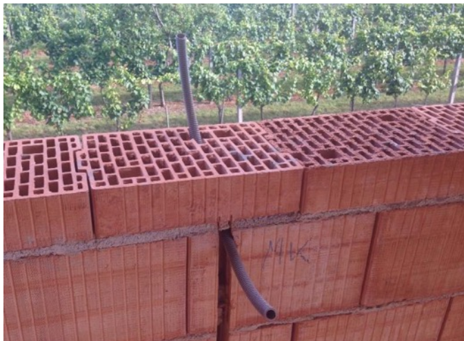
Nepravilno pripravljena okenska odprtina (novogradnja)

Pred montažo je potrebno slike pripravljenih okenskih odprtin poslati v pregled Tomažu Maliju, na mail tomaz.mali@m-sora.si .