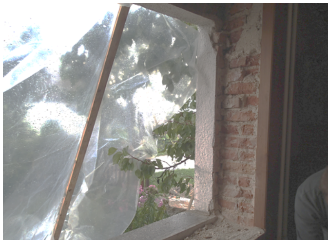
Nepravilno pripravljena okenska odprtina (prenova)